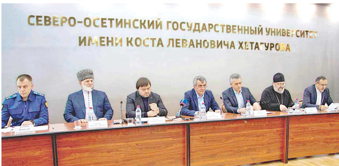
СЕВЕРО-ОСЕТИНСКИЙ ГОСУДАРСТВЕННЫЙ УНИВЕРСИТЕТ ИМЕНИ КОСТА ЛЕВАНОВИЧА ХЕТАУРОВА