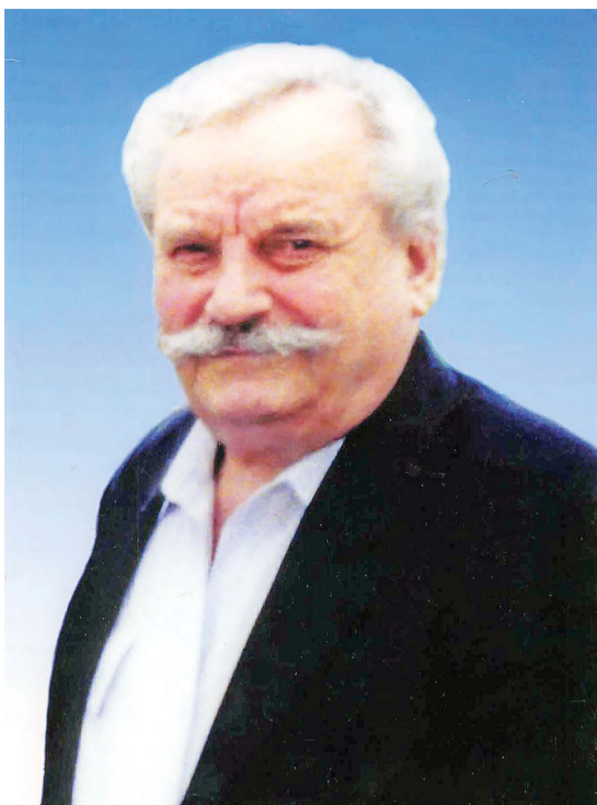
ООО «Газпром трансгаз Ставрополь». При нём были построены и введены в эксплуатацию компрессорные цеха: №2 – в 1970 г. и №3 – в 1984 г. Каждый – на 5 газоперекачивающих