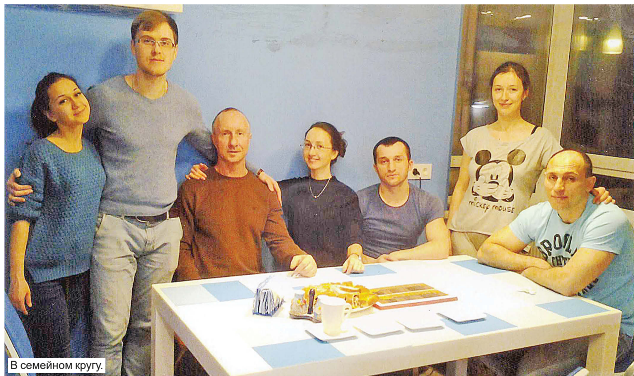
В семейном кругу.