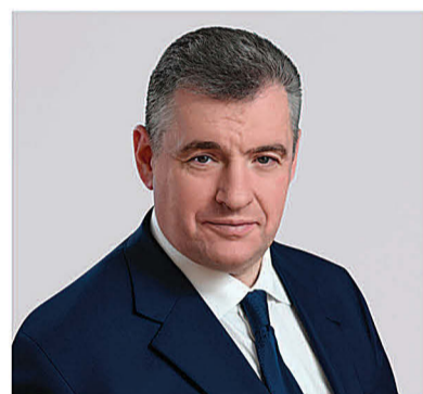
СЛУЦКИЙ ЛЕОНИД ЭДУАРДОВИЧ

1968 года рождения; место жительства – город Москва; Государственная Дума Федерального Собрания Российской Федерации, депутат, руководитель фракции Политической партии ЛДПР – Либерально-демократической партии России, председатель Комитета Государственной Думы по международным делам; выдвинут политической партией «Политическая партия ЛДПР – Либерально-демократическая партия России»; член политической партии «Политическая партия ЛДПР – Либерально-демократическая партия России», Руководитель Высшего Совета партии, Председатель партии