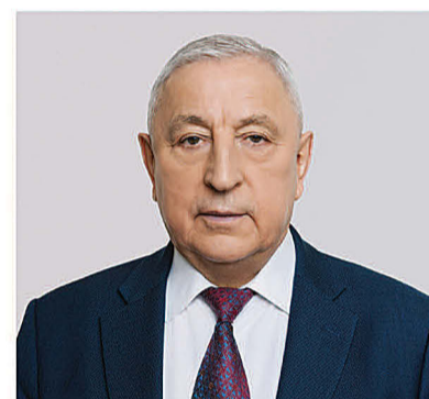
ХАРИТОНОВ НИКОЛАЙ МИХАЙЛОВИЧ

1948 года рождения; место жительства – город Москва; Государственная Дума Федерального Собрания Российской Федерации, депутат, председатель Комитета Государственной Думы по развитию Дальнего Востока и Арктики; выдвинут политической партией «Политическая партия «КОММУНИСТИЧЕСКАЯ ПАРТИЯ РОССИЙСКОЙ ФЕДЕРАЦИИ»; член политической партии «Политическая партия «КОММУНИСТИЧЕСКАЯ ПАРТИЯ РОССИЙСКОЙ ФЕДЕРАЦИИ», член Центрального Комитета партии, член Президиума Центрального Комитета партии