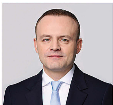
ДАВАНКОВ ВЛАДИСЛАВ АНДРЕЕВИЧ

1984 года рождения; место жительства – город Москва; Государственная Дума Федерального Собрания Российской Федерации, депутат, заместитель Председателя Государственной Думы, член Комитета Государственной Думы по бюджету и налогам; выдвинут политической партией «Политическая партия «НОВЫЕ ЛЮДИ»; член политической партии «Политическая партия «НОВЫЕ ЛЮДИ», член Центрального совета партии